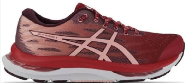
Tênis Asics Gel-Hypersonic 3 - Feminino - Rosa

Já deu pra perceber que nem sempre a loja da marca é o mais barato, certo? E como você irá fazer para descobrir o que compensa mais?