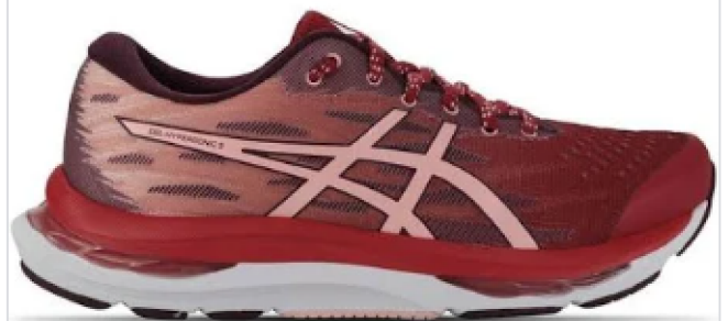
Tênis Asics Gel-Hypersonic 3 - Feminino - Rosa